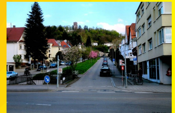
Verlängerung geplant seit 1907